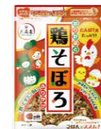
彩り野菜と鶏そぼろふりかけ