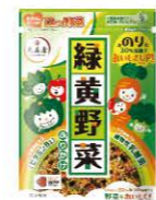
緑黄野菜ふりかけ